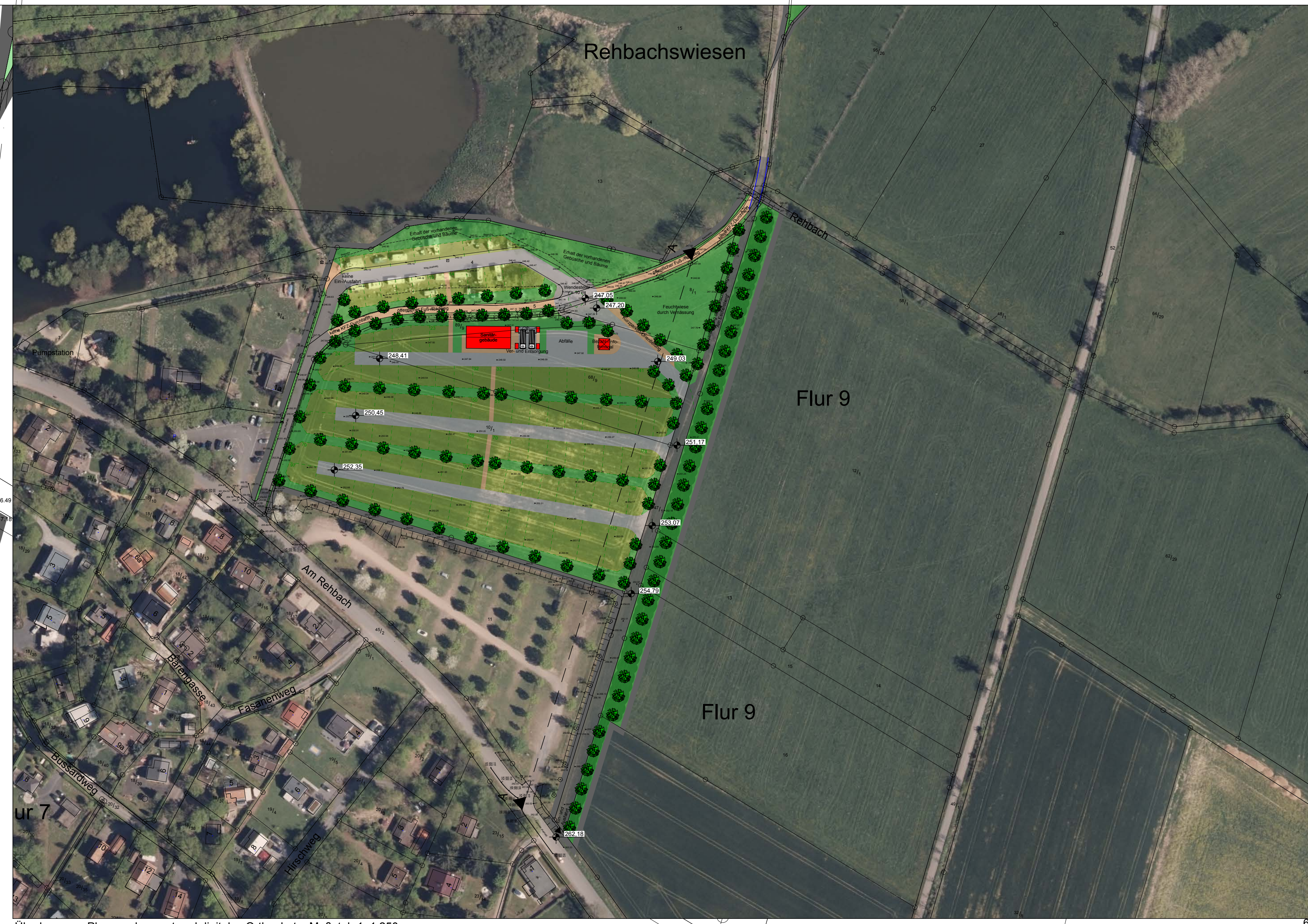
Überlagerung Planungskonzept und digitales Orthophoto, Maßstab 1:1.250